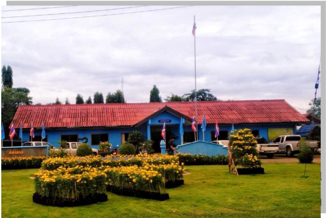
องค์การบริหารส่วนตำบลตากตก อำเภอบ้านตาก จังหวัดตาก